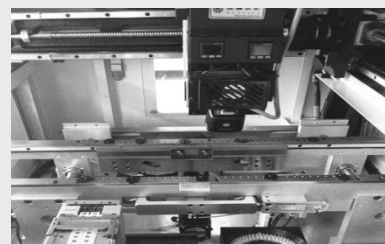
松下伺服驱动贴装头 Panasonic servo drives mouter head