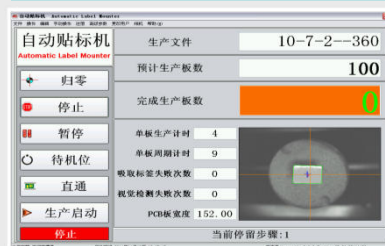
操作控制系统 Operation control system